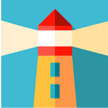
Mee Pya Tike

မီးပြတိုက်သည် လတ်တလောတွင် ဝန်ဆောင်မှုများ ရပ်ထားပြီး ၂၀၂၁ မေလတွင် ပြန်လည် လည်ပတ်သွားမည်ဖြစ်သည်။ ဆက်သွယ်ရန် - hello@meepyatike.com